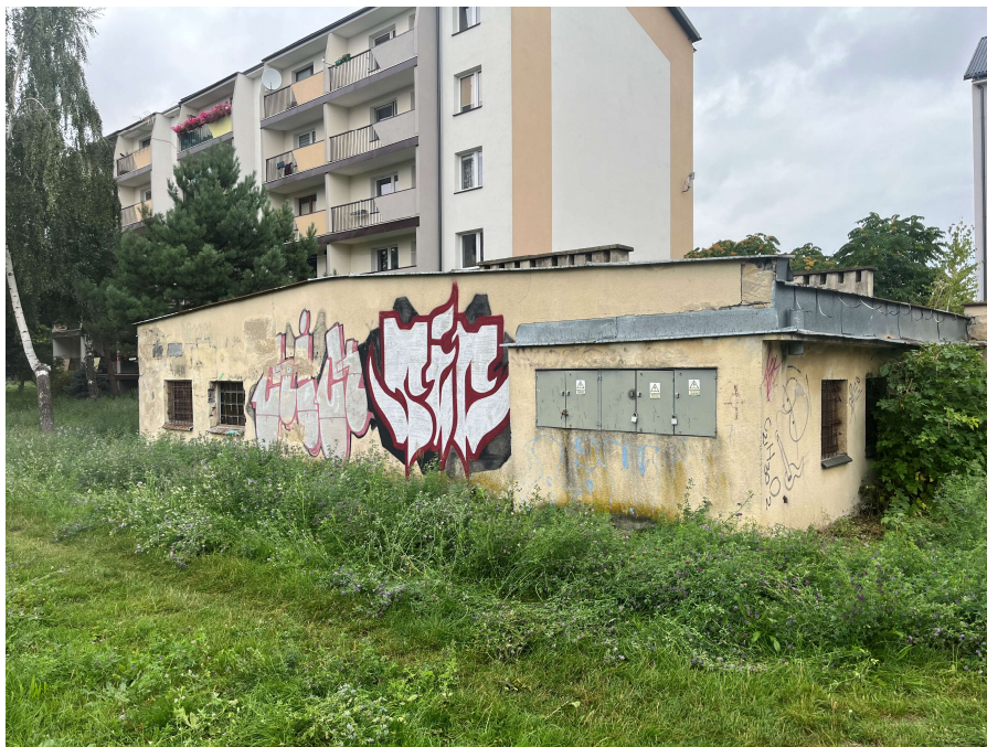
Widok budynku od strony zachodniej