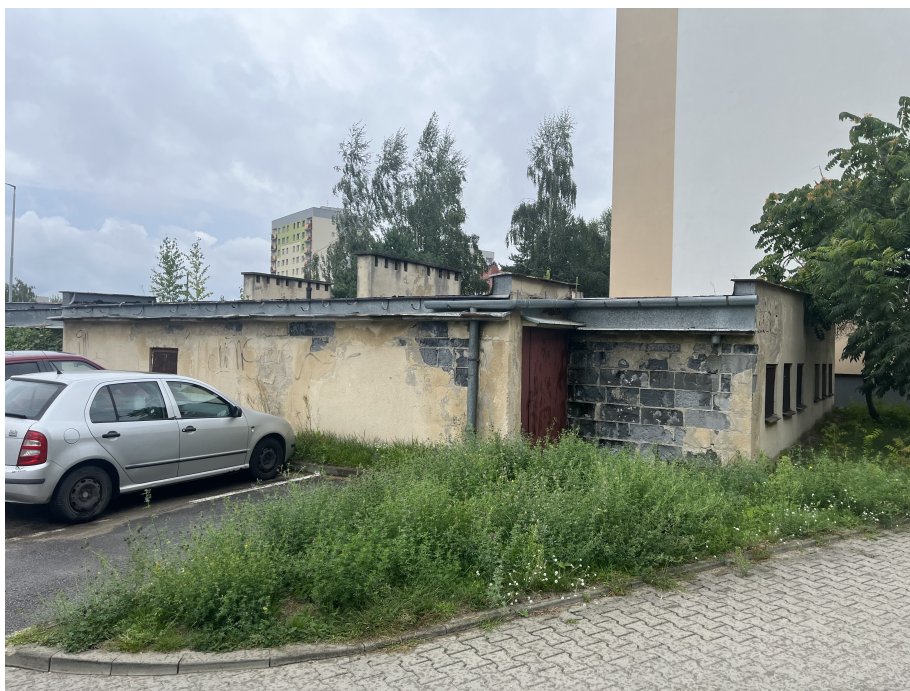
Strona południowa budynku